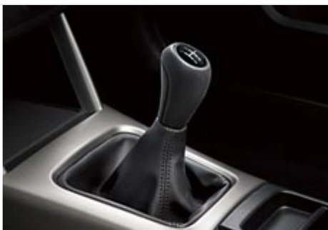
Řadící páka pětirychlostní přímo řazené převodovky (5MT)

v součinnosti se systémem pohonu všech kol Symmetrical AWD, který zaručuje vrcholný řídicí zážitek za všech podmínek.