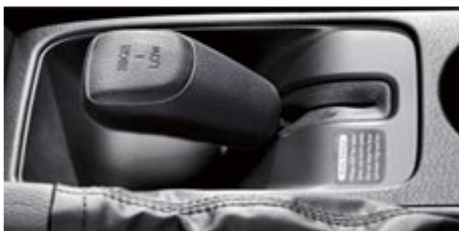
Volič redukční převodovky (u provedení 2,0 XS a 2,0 X 5MT)