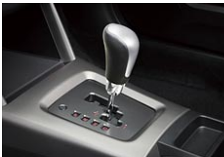
Volící páka a kulisa elektronicky řízené automatické převodovky (SPORTSHIFT® E-4AT)