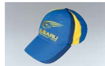
97 Basebalová čepice „WRC-Team“ WRC-205 N Sportovní vzhled.