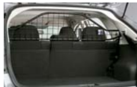
55 Ochranná mříž do zavazadlového prostoru F555EFG000 W Odděluje prostor pro přepravu zavazadel od prosotoru pro cestující.