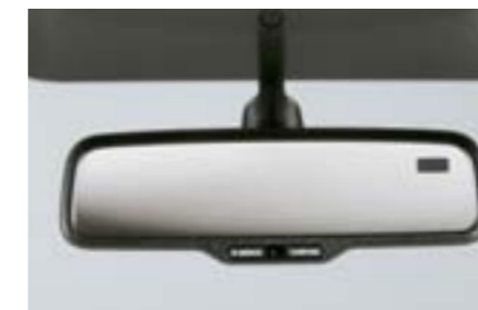
72 Samostmívací zpětné zrcátko s kompasem H501SFG000 W Obsahuje elektronický kompas. Automaticky se zatmavuje při zvýšené intenzitě světla od vzadu jedoucích vozidel. *Nutno použít adaptér.