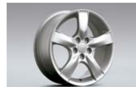
22 Kola z lehkých slitin 6,5 x 16", ET 55 28111FE311 W Nutné použít kryt na náboj.