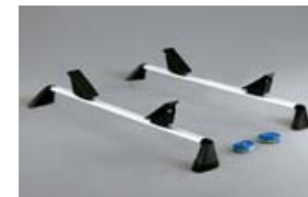
40 Nosič loží E361EAG600 W Pro 1 kajak *Bez střešního nosiče