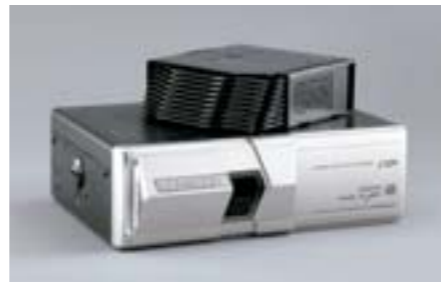
85 CD changer – měnič / A/V vstup H621EAG000 / H6210FG900 W Pro vozidla vybavená navigací, OEICD audiem a OE6CD changerem *H6210FG900: Konzole pro CD-měnič na 10 disků.