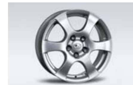
19 Kola z lehkých slitin 7,0 x 17", ET 48 2747 W