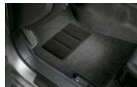
65 Podlahové koberce šedé, Standard J505EFG100 W Elegantní textilní koberce. *Sada předních a zadních koberců.