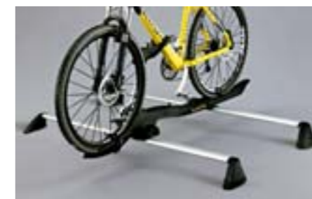
44 Nosič kol (Barracuda) E361ESA501 W Držák kola aerodynamického designu. Jednoduchá instalace. *Bez střešního nosiče