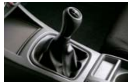
69 Kožená hlavice řadící páky (manuální převodovka) 35022AG000 W Ergonomicky tvarovaná kožená řadící páka pro vozidla s manuální převodovkou.

Vozidlo na obrázku je vybaveno: Hliníkovou hlavici řadící páky, popelníkem, zvýšenou středovou opěrkou a navigací.