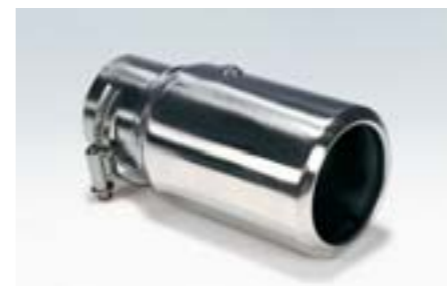
14 Ozdobná koncovka výfuku – kulatá 2021 N Sportovní koncovka výfuku dodávající vozu agresivní vzhled.