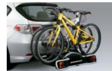
45 Zadní nosič kol (2 kola) E365EFG700 W Přeprava 2 jízdních kol na tažném zařízení. *Montáž na tažné zařízení