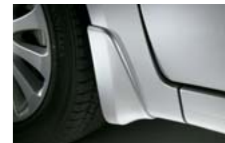
29 Přední lapače nečistot