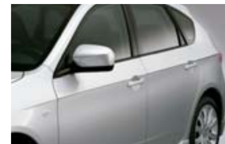
8 Dekorativní boční lišty E755EFG200 W Dodají Vašemu vozu zcela osobitý vzhled. Chromový vzhled.