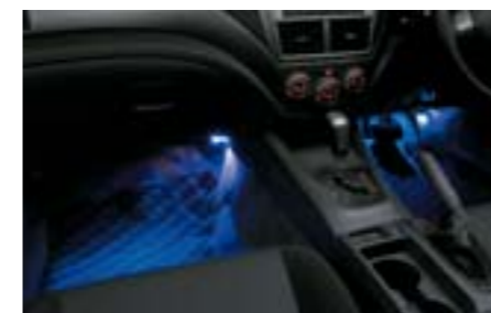
62 Osvětlení prostoru pro nohy H7010FG000 W Automaticky podsvítí prostor pro nohy při otevření předních dveří. Zpřijemňuje nastupování a vystupování z vozidla.