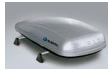
39 Střešní box (krátký) E361EYA801 W Rozměry: 1,792 x 797 x 355 mm. Objem: 380 litrů. *Bez střešního nosiče