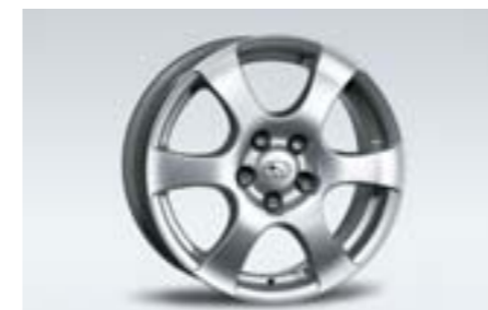
24 Kola z lehkých slitin 6,5 x 16", ET 48 2746 N