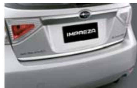
9 Dekorativní lišta zadních dveří E755EFG000 W Stylová lišta hrany víka zavazadlového prostoru. Chromový vzhled.