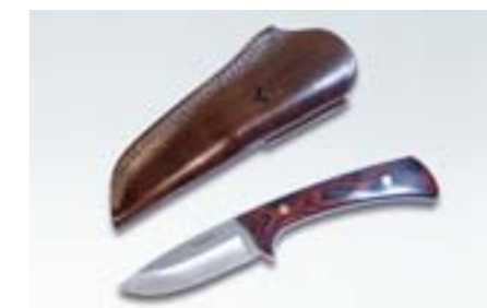
100 SUBARU nůž 9055 N Robustní provedení.