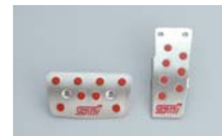
81 Sada pedálů STI (automatická převodovka) C8110AG010 W Sportovní pedály vyrobené z lehkých slitin. *Pro vozidla s levostranným řízením bez krytu pedálů.