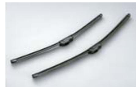
15 Aerodynamické stírače SEBOFG8000 E Aerodynamický design a zlepšená stírací schopnost.