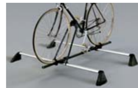
43 Nosič kol (základní) E361ESA701 W Perfektně sedne na střešní nosič. *Bez střešního nosiče