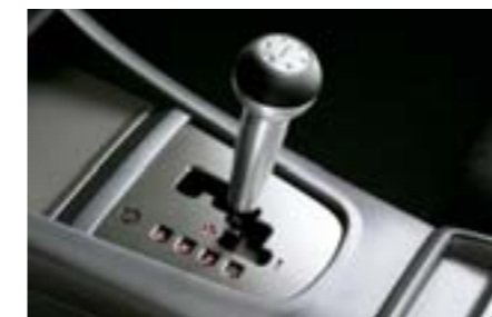
70 Hliníková sportovní hlavice řadící páky (automatická převodovka) C101ESA002 W Stylová hliníková hlavice ovládání převodovky s logem Subaru.