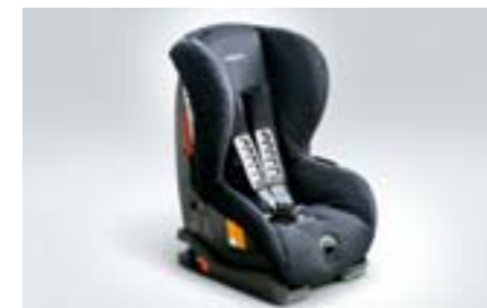
94 Dětská autosedačka SUBARU Baby duo plus F410EYA002 W Bezpečné upevnění sedačky pomocí systému ISOFIX.