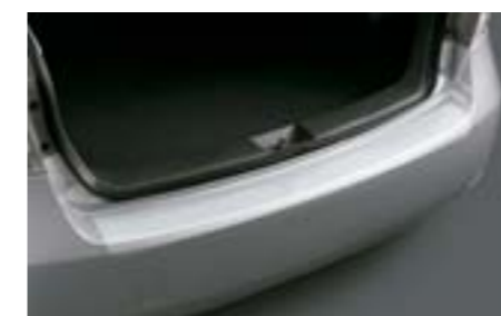
35 Ochrana nakládací hrany (fólie)

Chrání zadní nárazník před poškozením při nakládání a vykládání.