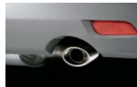
11 Koncovka výfuku (motor 1.5) D0510FG000 W Nerezová koncovka výfuku dodávající vozu sportovní vzhled.