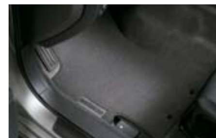
64 Podlahové koberce šedé, Premium J505EFG200 W Elegantní textilní koberce s logem. *Sada předních a zadních koberců.