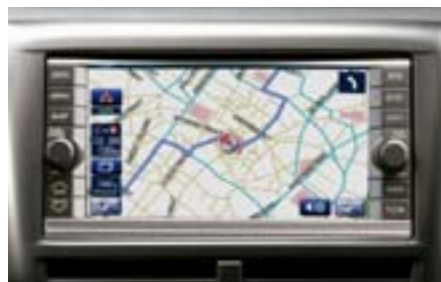
86 Navigace H001EFG000 W Výjimečný design, uživatelsky přívětivé rozhraní s ovládáním a zadáváním cílů pomocí touchpanelu. Obsahuje rádio, CD přehrávač, DVD přehrávač a přípravu pro Bluetooth handsfree. *DVD mapa není součástí.