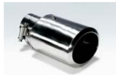
13 Ozdobná koncovka výfuku – oválná 2022 N Sportovní koncovka výfuku dodávající vozu agresivní vzhled.