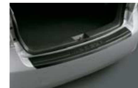
34 Ochrana nakládací hrany (plast)

Chrání zadní nárazník před poškozením při nakládání a vykládání.