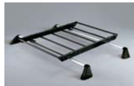
37 Zahrádka E361EAG700 W Výrazně zvýší užžitnou hodnotu vašeho vozu. *Bez střešního nosiče