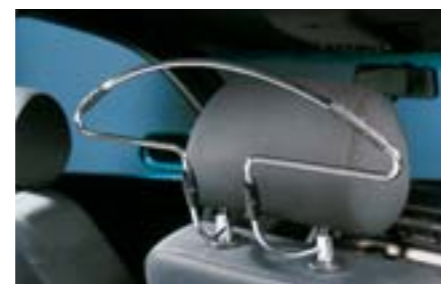
79 Ramínko na oděvy 2405 N Praktický doplněk nejen pro Vaše služební cesty. *Montáž na opěrku hlavy

Vozidlo na obrázku je vybaveno: Hliníkovou hlavici řadící páky, popelníkem, zvýšenou středovou opěrkou a navigací.