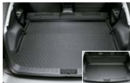
57 Podlážka zavazadlového prostoru – sklopná J515EFG100 W Ochrana prostoru pro přepravu zavazadel před znečištěním. Navíc zvýšená ochrana zadních sedadel při jejich sklopení.