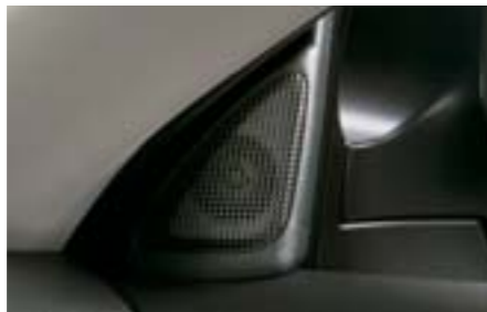
83 Výškové reproduktory – sada H6310FG000 W Speciálně vyvinuté reproduktory zvýrazní vysoké frekvence přehrávaného zvuku. *Pro originální audio soustavu.