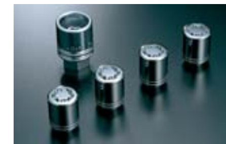
27 Bezpečnostní matice B327EYA000 W Pomáhá ochránit vaše pneumatiky a disky před zloději.