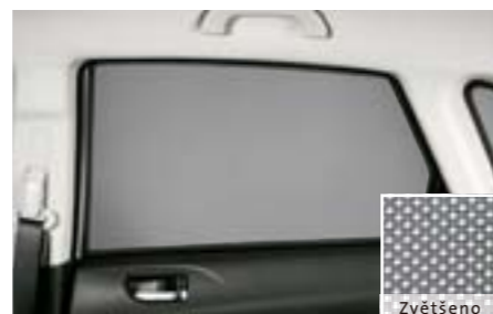
52 Sluneční clona (zadní dveře) F505EFG200 W Ochrana před slunečním zářením. (síťka)