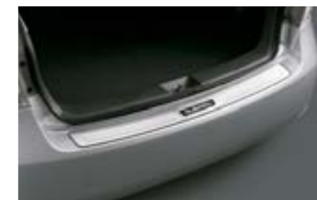
33 Ochrana nakládací hrany (nerez)

Zvýší ochranu bočních dveří proti poškození ostrými hranami.