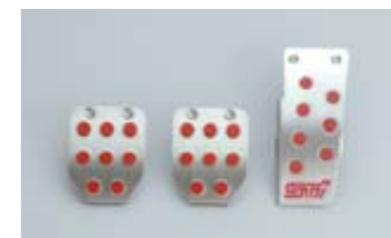
80 Sada pedálů STI (manuální převodovka) C8110AG000 W Sportovní pedály vyrobené z lehkých slitin. *Pro vozidla s levostranným řízením bez krytu pedálů.

FHI a STI spolupracovaly na vytvoření konceptu „total tuning“ pro zvýraznění vzhledu sériového vozidla.