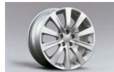
17 Kola z lehkých slitin 7,0 x 17", ET 55 28111FG020 W Nutné použít kryt na náboj.