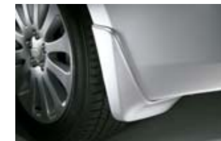
30 Zadní lapače nečistot

Ochrana vozu proti odletujícím sněhu a kamenům. *Vyžaduje lakování