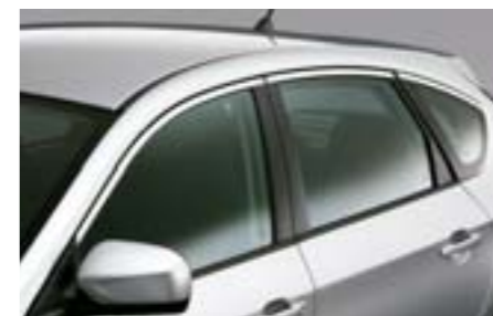
7 Dekorativní lišty oken E755EFG100 W Zvýrazní linie Vašeho vozu. Chromový vzhled.