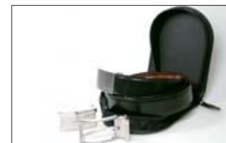
99 Elegantní opasek „cestovní sada“ 2585 N 3 výměnné přezky.