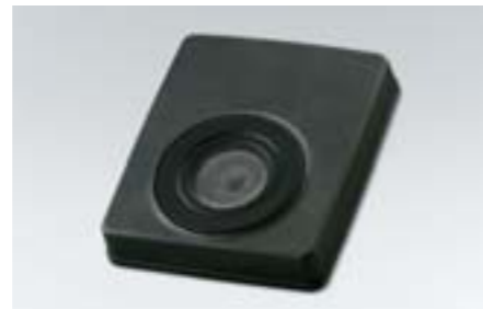
84 Subwoofer H630SFG000 W Přidá k audio soustavě 120 wattů výkonu a basů, které nejen uslyšíte ale také ucítíte.