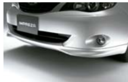
1 Přední spodní spoiler E2410FG000NN W Dává vozu agresivní vzhled. *Vyžaduje lakování