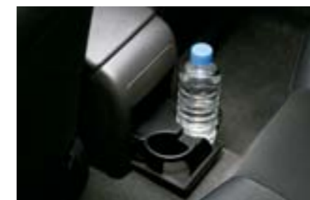
77 Držák nápojů pro cestující vzadu J2010FG010MG W Držák nápojů pro cestující vzadu.