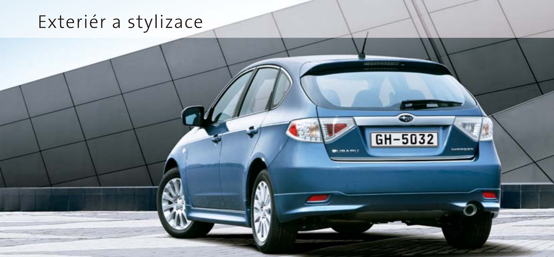
Vůz na obrázku je vybaven: spodním spoilerem zadního nárazníku, bočními prahovými spoilery, dekorativními bočními lištami, lištami bočních oken a lištou dveří zavazadlového prostoru.