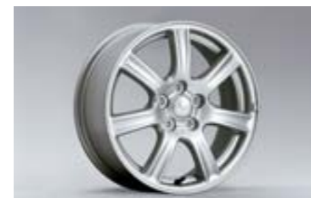
21 Kola z lehkých slitin 6,5 x 16", ET 55 28111AG001 W Nutné použít kryt na náboj.