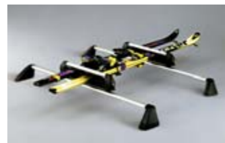
42 Nosič lyží (maximálně 4 páry) E361EAG500 W Pro 4 páry lyží nebo 2 snowboardy. Využitelná šířka 350 mm. *Bez střešního nosiče