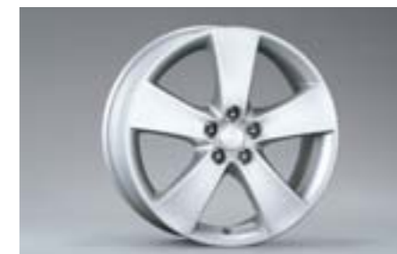
18 Kola z lehkých slitin 7,0 x 17", ET 48 SECWAG4101 E Nutné použít kryt na náboj.