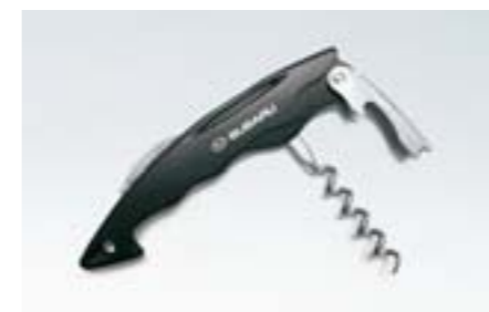
98 SUBARU multifunkční otvůrka „Sharky“ 2462 N Praktický pomocník.