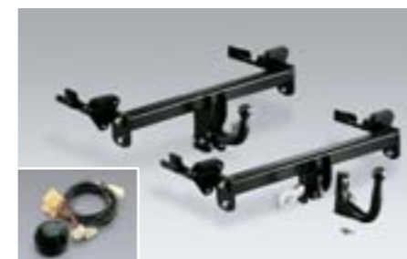
49 Tažné zařízení (odnímatelné, pevné) Viz seznam příslušenství W *Maximální zatížení tažného zařízení se může měnit v závislosti na výbavě vozu. Pro více informací kontaktujte prodejce.

Vůz na straně 10 je vybaven předním spodním spoilerem, bočním prahovým spoilerem, zadním spodním spoilerem, sportovní maskou chladiče, dekorativními lištami oken, dekorativními bočními lištami, střešními nosiči a střešním boxem.