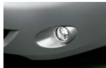
5 Mlhovky H4510FG010 W Zlepšený výhled z vašeho vozu při špatném počasí.