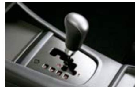
68 Kožená hlavice řadící páky (automatická převodovka) 35160FG010JC W Ergonomicky tvarovaná kožená řadící páka pro vozidla s automatickou převodovkou.