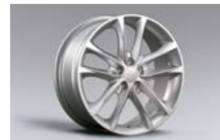
16 Kola z lehkých slitin 7,0 x 17", ET 55 B3110FG100 W Nutné použít kryt na náboj.