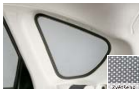
53 Sluneční clona (zadní čtvrtina) F505EFG100 W Chrání zavazadlový prostor před slunečním zářením a zatemňuje jej. (síťka)