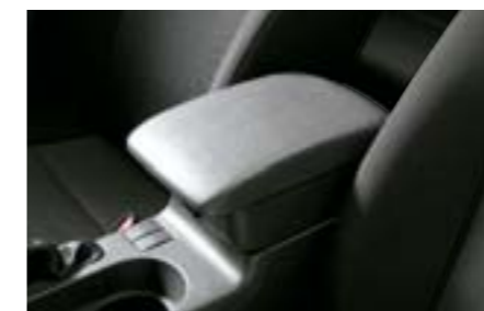
76 Zvýšená středová loketní opěrka J2010FG000MG W Extenze stávající loketní opěrky zvyšující jízdní komfort a zlepšující užité vlastnosti.