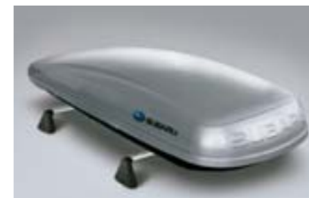
38 Střešní box (dlouhý) E361EYA900 W Rozměry: 2,267 x 805 x 355 mm. Objem: 430 litrů. *Bez střešního nosiče