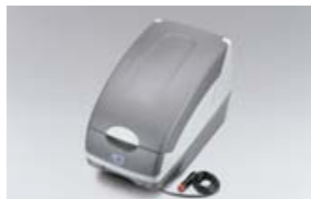
51 Lednička SEWAYA1000 E Pomáhá udržovat nápoje a potraviny při optimální teplotě.