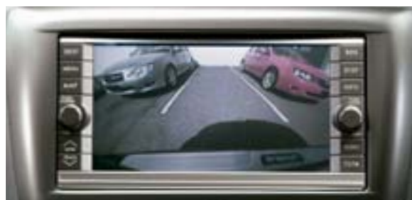
89 Parkovací kamera H0010FG000 W CCD kamera s vysokým rozlišením 250-000 pixelů, která při zařazeném zpětném chodu automaticky zobrazí prostor za vozem na displeji navigace. Má horizontální úhel 183.3° a vertikální úhel 91.6°. *Pouze s navigačním systémem.