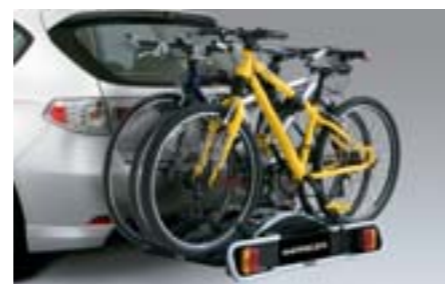
46 Zadní nosič kol (3 kola) E365EFG900 W Přeprava 3 jízdních kol na tažném zařízení. *Montáž na tažné zařízení