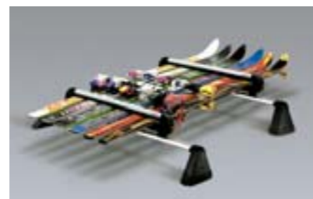
41 Nosič lyží (maximálně 6 párů) E361EAG550 W Pro 6 párů lyží nebo 4 snowboardy. Šířka: 640 mm. *Bez střešního nosiče