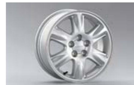
25 Kola z lehkých slitin 6,0 x 15", ET 48 28111SA011 W Nutné použít kryt na náboj.