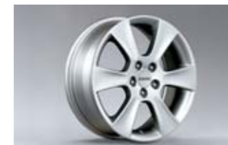
23 Kola z lehkých slitin 6,5 x 16", ET 48 SECWAG4001 E Nutné použít kryt na náboj.