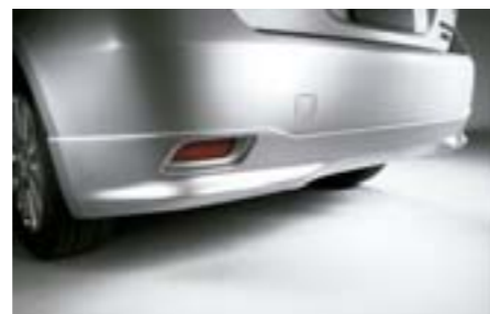
3 Zadní spodní spoiler E5610FG000NN W Dává vozu agresivní vzhled. *Vyžaduje lakování