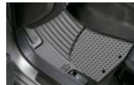
66 Gumové koberce J505EFG000 W Odolné pryžové rohožky, které chrání koberce vozu před znečištěním. *Sada předních a zadních koberců.