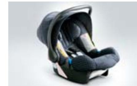
93 Dětská autosedačka SUBARU Baby safe plus F410EYA102 W Vybavena sluneční clonou.