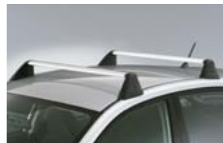
36 Hliníkové střešní nosiče E3610FG500 W Aerodynamické profily pro převoz zavazadel na střeše vozu.