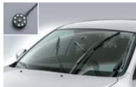
50 Dešťový senzor SEWAYA8000 E Automaticky aktivuje stírače vozu. *Ovládání pomocí podsvíceného spínače.