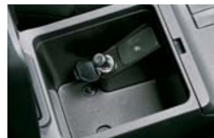
74 Zapalovač cigaret H6710FG000 W Změní 12V zásuvku na zapalovač cigaret.