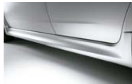
2 Boční prahový spoiler E2610FG000NN W Dává vozu agresivní vzhled. *Vyžaduje lakování