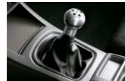
71 Hliníková sportovní hlavice řadící páky (5-ti stupňová man. převodovka) C105EFE000 W Stylová hliníková řadící páka s logem Subaru.