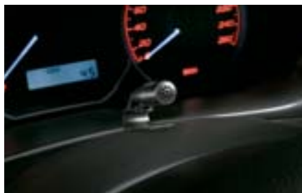
87 Mikrofon handsfree sady H0018FG300 W Umožňuje bezdrátové telefonování při použití mobilního telefonu vybaveného Bluetooth rozhraním. *Pouze s navigačním systémem.