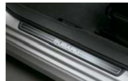
63 Prahové lišty E1010FG000 W Nahrazují sériově dodávané prahové lišty, mají sportovnější vzhled. *Sada pro přední a zadní prahy.