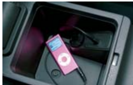
82 Externí audio vstup autorádia – sada H6210FG000 W Externí přípojka standardního tvaru (3.5mm audio jack) Vám umožní poslechnout hudbu z vašeho přenosného přehrávače prostřednictvím audio soustavy vozu. *Pro originální audio soustavu.