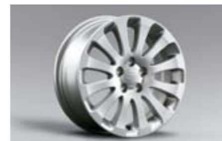
20 Kola z lehkých slitin 6,5x16", ET 55 28111FG010 W Nutné použít kryt na náboj.