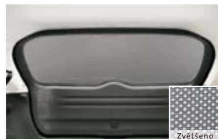
54 Sluneční clona (zadní) F505EFG000 W Chrání zavazadlový prostor před slunečním zářením a zatemňuje jej. (síťka)