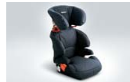
96 Dětská autosedačka F410EYA212 W Zvýšená ochrana při bočním nárazu.