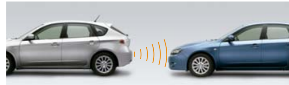
91 Ultrazvukový parkovací asistent se 4-mi couvacími senzory Přední ultrazvukové senzory (2 nebo 4 kusy) pro rozšíření parkovacího asistenta 2470. 2470 / 2470-01 E Bezpečné a snadné parkování pomocí 2 snímačů vzadu (akustické a optické varování) s možností rozšíření o 2 snímače vpředu (pouze s 2470-01). 2470: Akustické a optické varování – indikační LED. 2470-01: Pro rozšíření systému 2470 na přední část vozu. (nezbytné jsou 2 nebo 4 kusy)