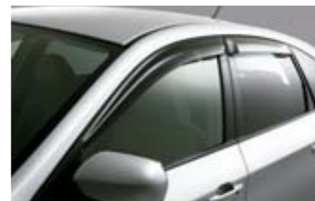
6 Deflektory oken E3610FG000 W Umožňuje ponechání otevřených oken za účelem větrání při zhoršeném počasí.