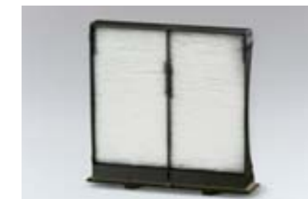
73 Pylový filtr 72880FG000 W Pomáhá zamezit pronikání prachu, pylu a zápachu do prostoru kabiny. Pro dosažení nejlepších výsledků se doporučuje vyměnit filtr jednou za rok nebo po ujetí každých 12.000 km. *Pro výměnu za originální pylový filtr