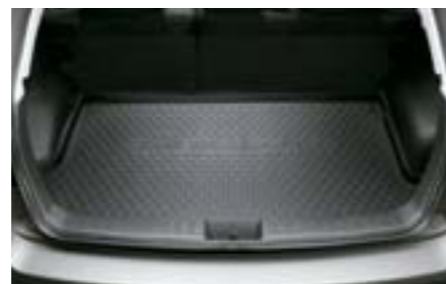
56 Podlážka zavazadlového prostoru J515EFG000 W Ochrana prostoru pro přepravu zavazadel před znečištěním.