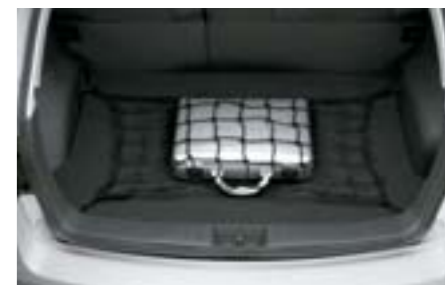
61 Síťka na podlahu kufru F5510FG000 W Pro čistý a uklizený nákladový prostor.