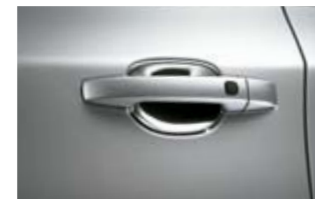
31 Ochrana karoserie kliky dveří

Ochrana vozu proti odletujícím sněhu a kamenům. *Vyžaduje lakování