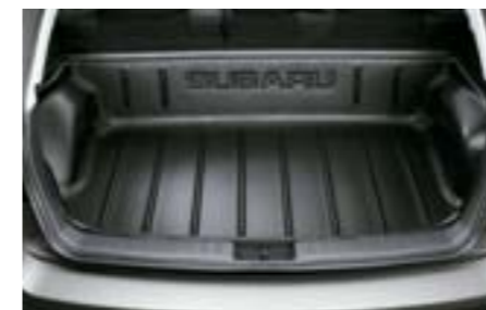
58 Zvýšená podlážka zavazadlového prostoru J515EFG200 W Zvýšená ochrana nákladového prostoru. Vhodné pro rybářeni a lov.