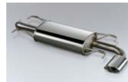
12 Sportovní výfuk SEREFG5000 E Vychutnejte nádherný zvuk motoru boxer pracujícího pod kapotou vašeho vozu. Vyroben z nerezové oceli.