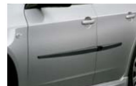
32 Boční lišty

Chromované ochranné kryty ochrání karoserii před poškrábáním. *Chromované