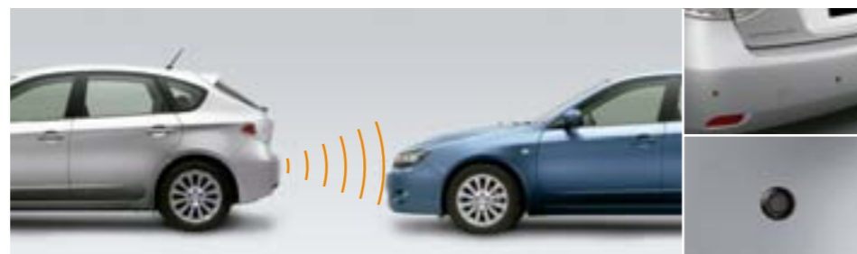
90 Ultrazvukové parkovací senzory (přední, zadní) SEWAFG2100, SEWAYA2000 E Přední: Bezpečné parkování pomocí 2 senzorů. Automatická aktivace na základě rychlosti vozu. Akustická signalizace. Zadní: Bezpečné parkování pomocí 4 senzorů. Akustická a optická signalizace.