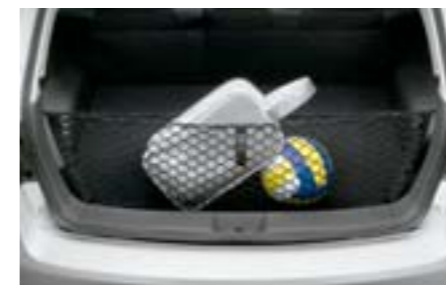
59 Síťka pro přepravu zavazadel (u zadního výklopného víka) F551SFG100 W Pro čistý a uklizený nákladový prostor.