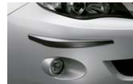
28 Ochranné lišty rohů nárazníků