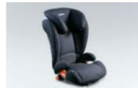
95 Dětská autosedačka SUBARU KIDFIX F410EYA213 W Bezpečné upevnění sedačky pomocí systému ISOFIX. Zvýšená ochrana při bočním nárazu.