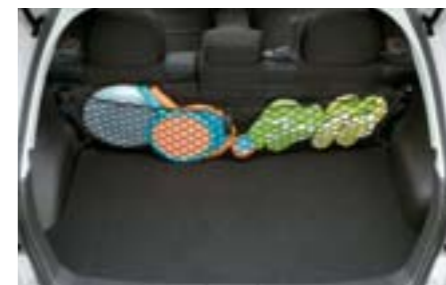
60 Síťka pro přepravu zavazadel (na zadní stranu sedadel) F551SFG200 W Pro čistý a uklizený nákladový prostor. Perfektní doplněk pro přepravu nákladu.