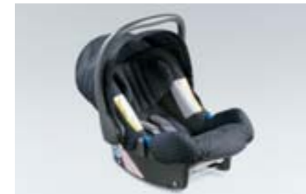
92 Dětská autosedačka SUBARU Baby safe ISOFIX plus F410EYA103 W Bezpečné upevnění sedačky pomocí systému ISOFIX.