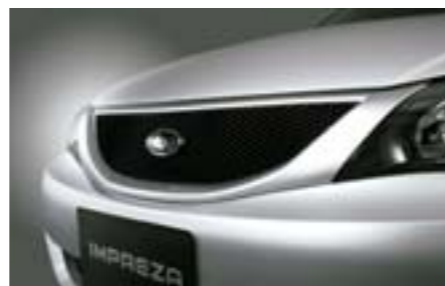
4 Sportovní maska chladiče J1010FG100NN W Sportovní mřížka chladiče dodá předí vašeho vozu zcela nový image. *Vyžaduje lakování