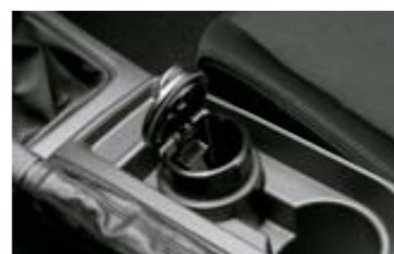
75 Popelník F6010FG000 W Popelník pohárkovitého typu určen pro upevnění do držáku nápojů na středové konzoli.