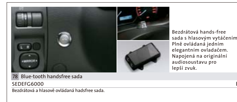
78 Blue-tooth handsfree sada SEDEFG6000 E Bezdrátová a hlasově ovládaná handsfree sada.

Bezdrátová hands-free sada s hlasovým vytáčením. Plně ovládaná jedním elegantním ovladačem. Napojená na originální audiosoustavu pro lepší zvuk.