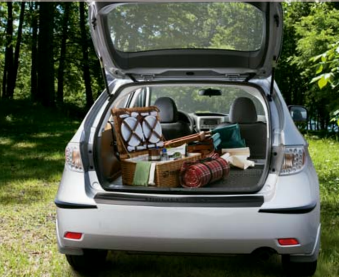
Vůz na obrázku je vybaven ochranou rohů nárazníků, lapači nečistot, ochranou nakládací hrany kufru a sklopnou podlážkou do zavazadlového prostoru.